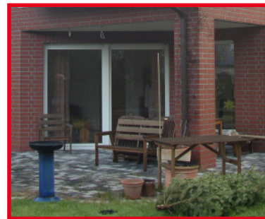
Variante Überdachte Terrasse